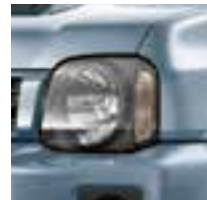
Breeze Blue Metallic (ZLU)