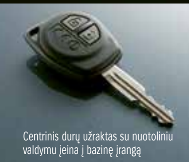
Centrinis durų užraktas su nuotoliniu valdymu įeina į bazinę įrangą