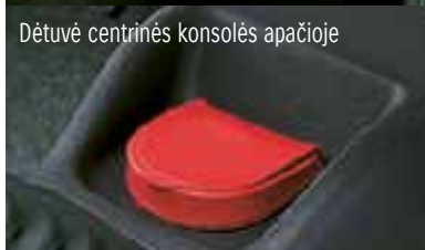
Dėtelė centrinės konsolės apačioje