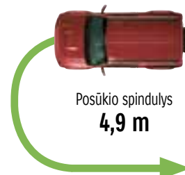
Posūkių spindulys 4,9 m

„Jimny“ gaminami su automatine keturių pavarų dėže arba su mechanine penkių pavarų dėže. Automatinės pavarų dėžės sukimo momento keitiklio blokas važiuojant greitkeliais padeda sutaupyti degalų.