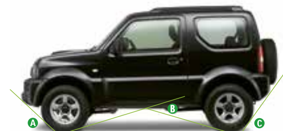
A Užvažiavimo kampas 37°