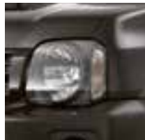
Quasar Gray Metallic (ZMA)