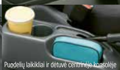
Puodelių laikikliai ir dėtelė centrinėje konsolėje