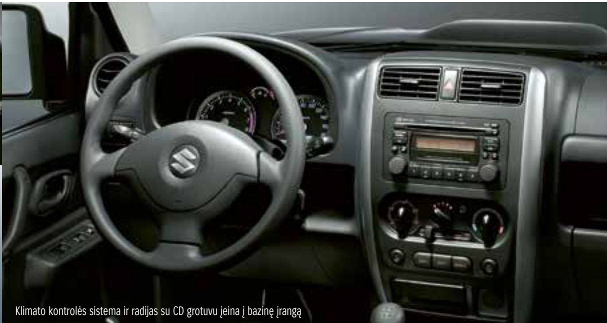
Klimato kontrolės sistema ir radijas su CD grotuvu įeina į bazinę įrangą