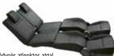
Visos sėdynės atlenktos atgal.

Patogios sėdynės ir apgalvotai išdėstyti kontrolės matavimo prietaisai leidžia vairuotojui visapusiškai mėgautis važiavimu. Vos užmetęs akį į prietaisų skydelį vairuotojas lengvai įžiūrės visą reikiamą informaciją. Ergonomiškų sėdynių atlošai užtikrina komfortą ilgose kelionėse. Kiekvienoje sėdynėje yra pakankamai vietos kojoms, keliams ir alkūnėms, tad visi visureigio „Jimny“ keleiviai važiuos patogiai. Galinės sėdynės nusilenkia atskirai. Automobilyje taip pat yra pakankamai kompaktiškų dėtelių.