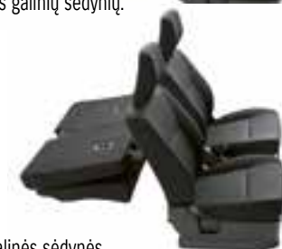
Nulenktos abi galinės sėdynės.