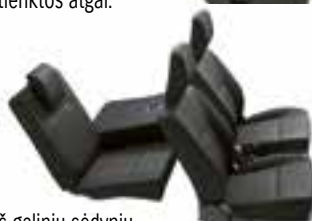
Nulenкта viena iš galinių sėdynių.