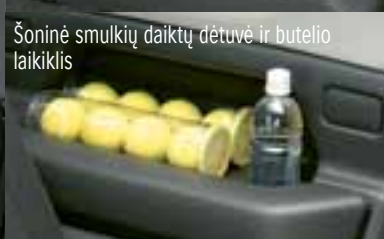
Šoninė smulkių daiktų dėtelė ir butelio laikiklis