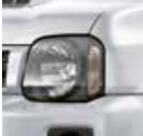
Superior White (26U)