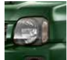
Ever Green Pearl Metallic (ZLC)