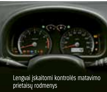
Lengvai įskaitomi kontrolės matavimo prietaisų rodmenys

Vos sėdę už „Jimny“ vairo, iš karto pajusite, kad šis automobilis sukurtas būtent jums. Pagrindinės valdymo priemonės yra po ranka, tiesiai prieš vairuotojo akis išdėstyty kontrolės matavimo prietaisų rodmenys lengvai įskaitomi, o visi pedalai ir rankenos dirba tiksliai ir sklandžiai. Ergonomiškose sėdynėse nejausite ilgos kelionės nuovargio, o aplink sėdynes yra pakankamai erdvės patogiai važiuoti keturiems suaugusiems asmenims.