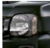
Bluish Black Pearl (Z13)