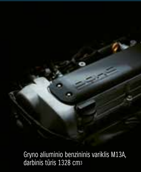
Gryno aliuminio benzininis variklis M13A, darbinis tūris 1328 cm 3