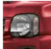
Phoenix Red Pearl (ZLB)