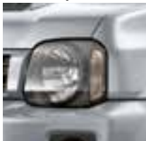
Silky Silver Metallic (Z2S)